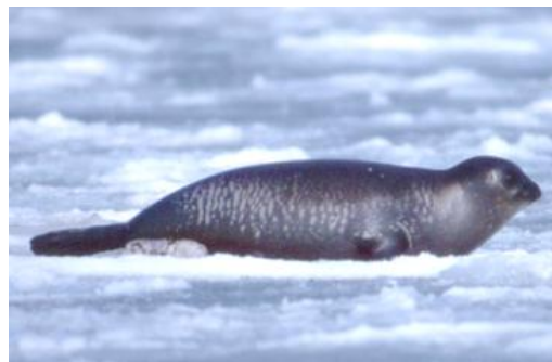
氷の上のゴマフアザラシ

雪が積もった草原には、ハギマシコやベニヒワなど草の種を食べる小鳥たちが集まってきます。また、海岸沿いから沖に向かって伸びた沿岸氷の上にアザラシが乗っていることがあります。