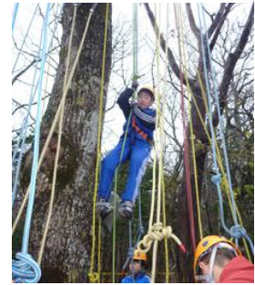
ツリーイングの様子

11月18日、施設ボランティアグループ「スルク」と一緒にネイチャーセンター祭りを開催しました。今年も昨年大人気だった木登り「ツリーイング」を知床山考舎の方をリーダーにお招きして行ったほか、おが粉アートや紙芝居など一日中楽しめるイベントを開催しました。また、新しい試みとして“ジュニア・アンサンブル・ねむろ”の皆さんによる弦楽コンサートを1階フロアで開催しました。小雨が降るあいにくな天気でしたが、120名とたくさんの方が参加してくださいました。