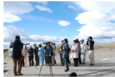
走古丹先端での観察

11月4日、風蓮湖を春国岱から走古丹先端まで回りながら、自然や文化を楽しむバスツアーを開催しました。風連川河口の広大なヨシ原や走古丹先端からみた風蓮湖の開口部など普段なかなか足を運ばない場所から風蓮湖を堪能しました。