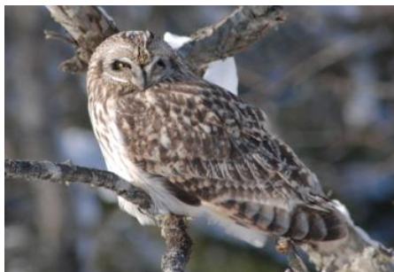
夕日を浴びるコミミズク

走古丹や春国岱の草原にコミミズクが渡ってきます。数はそれほど多くありませんが、朝・夕の少し明るい時間にも飛ぶので、フクロウの仲間では比較的観察しやすい種類です。だんだん寒さが厳しくなりますが、凍った湖面を歩いていくエゾシカの群れやキタキツネ、森の中でエサを探すエゾリスや動物たちの足跡など、冬ならではの風景が見られるようになります。