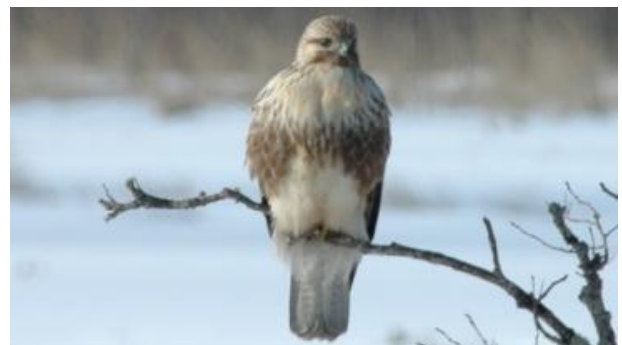
英名 Common Buzzard 学名 Buteo buteo